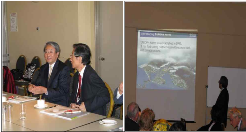
<제 22회 EAROPH Council Meeting 회의모습>