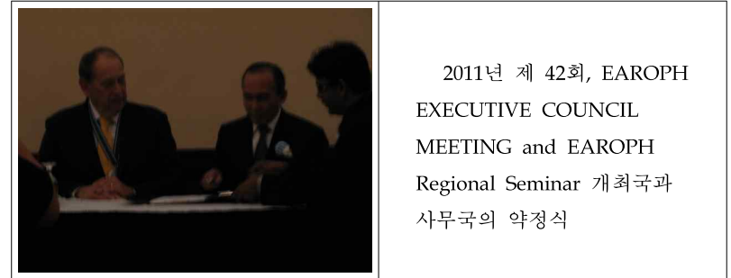
2011년 제 42회, EAROPH EXECUTIVE COUNCIL MEETING and EAROPH Regional Seminar 개최국과 사무국의 약정식