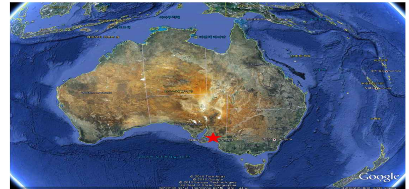
<호주 애들레이드 위치도>